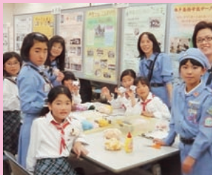
毛糸でブローチ作り

県央ブロック(水戸市・笠間市・小美玉市・茨城町・大洗町・城里町)ボランティア活動推進会議が、イオンモール水戸内原のイオンホールにて、11月18日～20日の3日間、地域・学校・施設で様々なボランティア活動をしている団体の活動の様子やボランティアに関する情報をパネルで紹介しました。またパソコンでクリスマスカード・伝承折り紙(連鶴折り)・毛糸でブローチ作り・使用済み切手整理・手話・バルーンアート体験・東日本大震災応援メッセージなどが行われ、家族づれや友人同士など多くの方の参加で賑わいました。