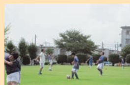
水戸市社会福祉事業団の愛パーク広場(河和田町)にて月2回サッカー教室開催