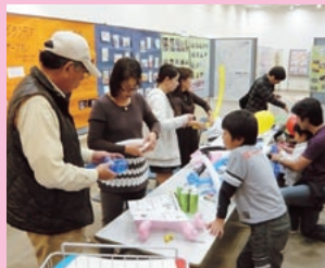
バルーンアート体験