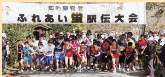
駅伝大会スタートの様様(昨年10/29 千波湖周回コース)