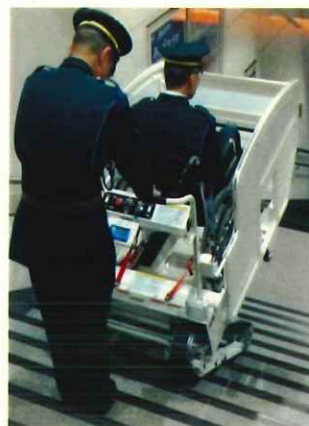
ステッピングカー使用イメージ