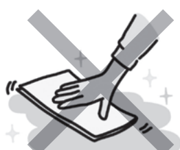
掃除などの家事全般