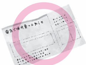
公共料金等の支払い