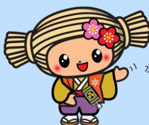
水戸市マスコットキャラクター