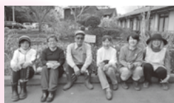
▲園芸ボランティア「花hana」