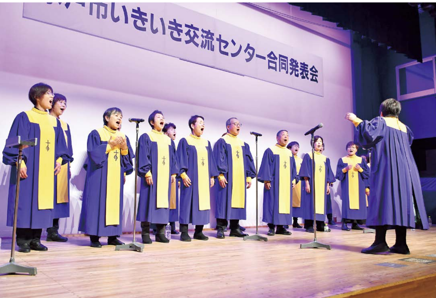
ゴスペル教室(いきいき交流センターあかしあ)の皆さまによる発表

1月23日(木)、24日(金)の2日間、ザ・ヒロサワ・シティ会館において、いきいき交流センター合同発表会を開催しました。この発表会は、市内全8センターの教室、クラブ受講生の日頃の成果を披露する目的で行われています。