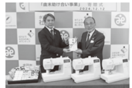
常陽ボランティア倶楽部様