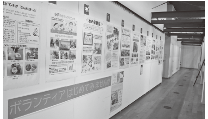
ボランティアサークル活動パネル展