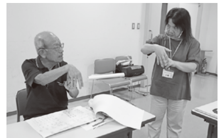
体験教室(手話・点字・要約筆記)