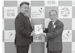
水戸ライオンズクラブ様