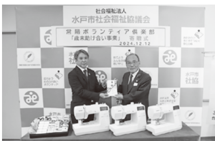
寄付物品受け入れ