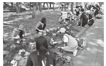
mito子どもボランティア隊