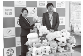
明治安田生命相互会社 水戸西営業所様