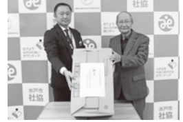
浜田地区高齢者クラブ連合会様