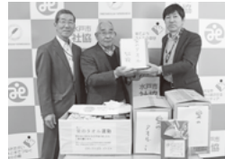
茨城県退職公務員連盟 水戸支部様