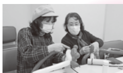
▲パルーンアートボランティア「ぱるーん・レインボー」