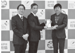
真如苑 水戸支部様