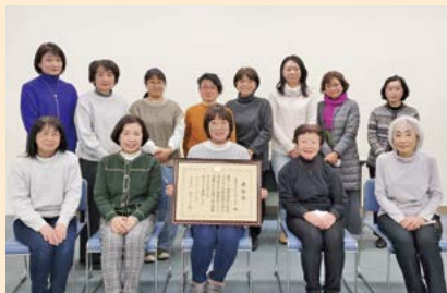
昨年、厚生労働大臣表彰を受賞