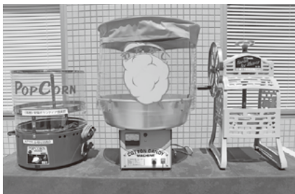
器材貸出(ポップコーン・綿あめ・かき氷)

地域の皆さんが、福祉やボランティアに興味を持ってもらえるようにたくさんの事業を行っています