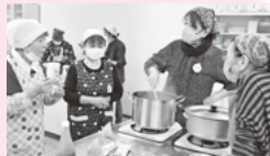
▲料理ボランティア「COOKぼーの」