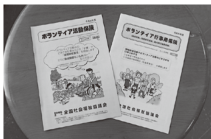
ボランティア活動・行事用保険手続