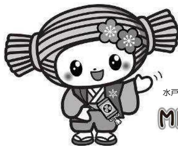
水戸市マスコットキャラクター